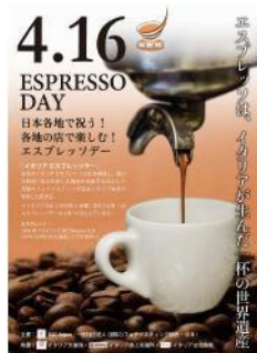
オリジナルポスタープレゼント