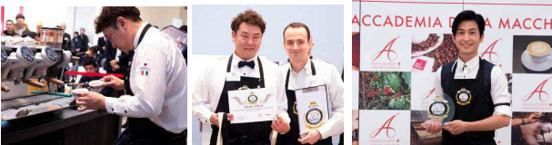
左) 第3回日本代表として世界大会に出場した時崎仙浩バリスタ。 中央) ベストフォーに進出決定した時崎バリスタと理事カルロ・オデッロ氏。 右) 2018年度ワールドチャンピオン台湾代表Mr. Chang Chung-Lunバリスタ。